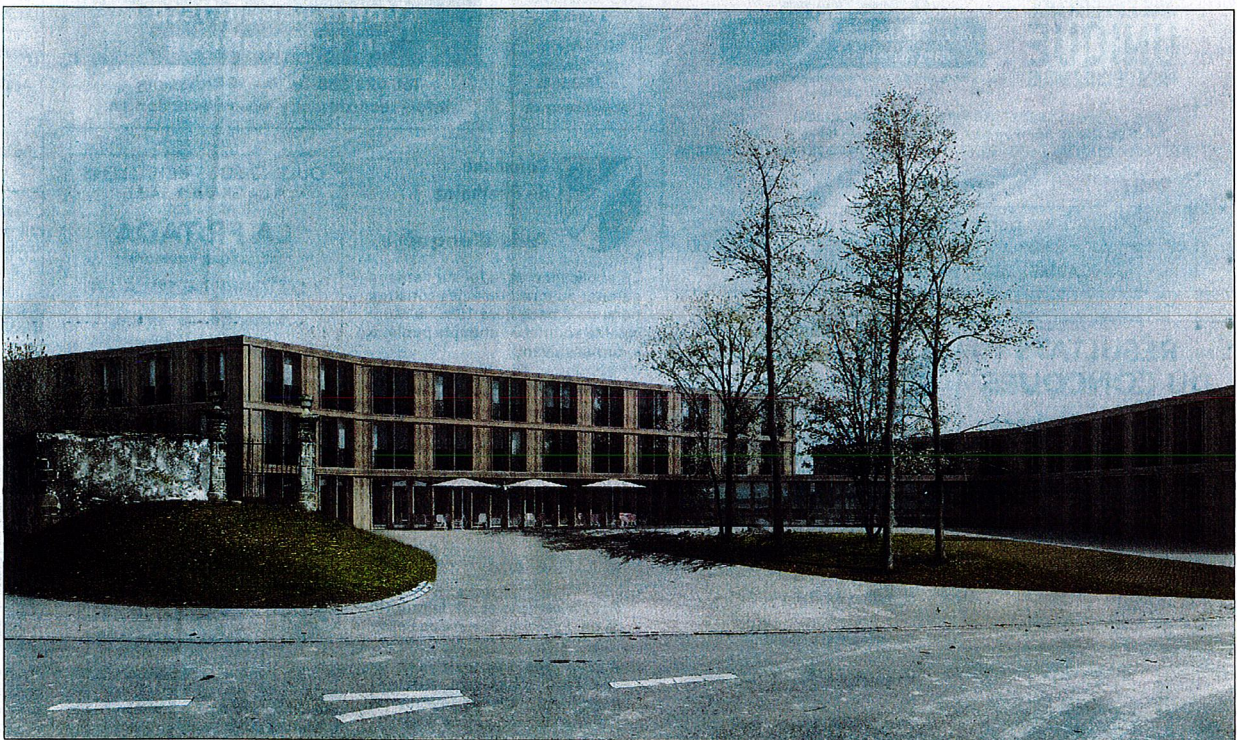
GNWA architectes Zurich