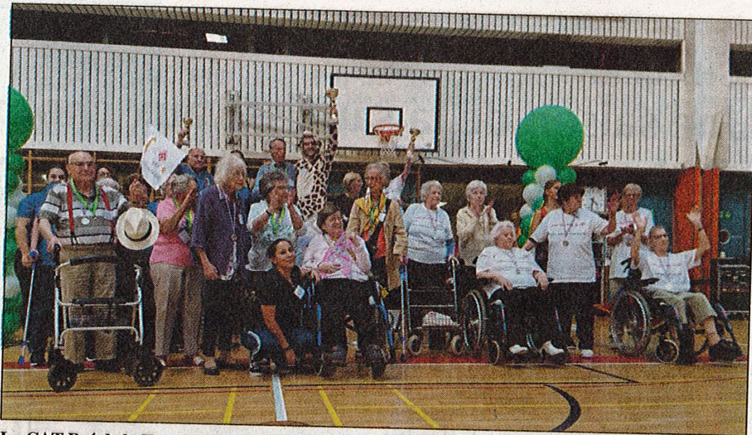
Le CAT Pré de la Tour a remporté ces jeux, suivi de l'EMS Sauvabelin et de l'EMS Grand Pré.

«Santez-vous bien! Santé-vous sport!». Tel était le slogan des premiers jeux des EMS du Quartier Romand de l'Animation qui ont rassemblé des résidents de onze institutions.